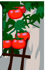
2008年8月1日はな子さつえい

「トマトが赤くなると 医者が青くなる」 トマトには、リコピンがたくさんはいつています。リコピンは、ガンや老化をふせいでくれるで、むかしからいわれている、「トマトが赤くなると、医者がまくなる」というのは、栄養満点のトマトのことをいっています。